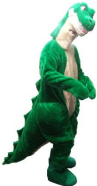
きぐるみ かいじゅうくん

1日9,000 2日11,250 3日13,500 4日14,625 5日15,750 6日16,875 7日18,000 その後+790 30日36,000