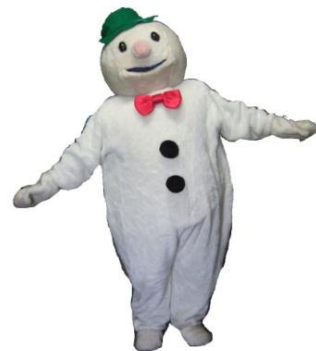
着ぐるみ ゆきだるま

1日9,000 2日11,250 3日13,500 4日14,625 5日15,750 6日16,875 7日18,000 その後+790 30日36,000