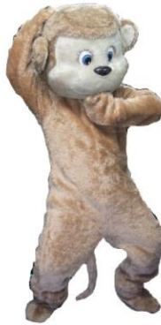
ぬいぐるみ モンキーちゃん

1日9,000 2日11,250 3日13,500 4日14,625 5日15,750 6日16,875 7日18,000 その後+790 30日36,000