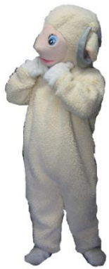
着ぐるみ ひつじさん

1日9,000 2日11,250 3日13,500 4日14,625 5日15,750 6日16,875 7日18,000 その後+790 30日36,000