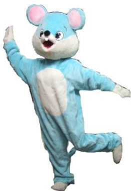
着ぐるみ ちゅーたん

1日9,000 2日11,250 3日13,500 4日14,625 5日15,750 6日16,875 7日18,000 その後+790 30日36,000