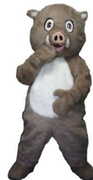
ぬいぐるみ イノちゃん

1日13,000 2日16,250 3日19,500 4日21,125 5日22,750 6日24,375 7日26,000 その後+1,130 30日52,000