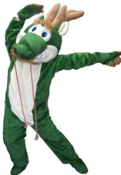
着ぐるみ ドラゴン

1日9,000 2日11,250 3日13,500 4日14,625 5日15,750 6日16,875 7日18,000 その後+790 30日36,000