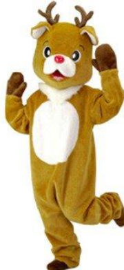
着ぐるみ 新赤鼻のトナカイ

1日9,000 2日11,250 3日13,500 4日14,625 5日15,750 6日16,875 7日18,000 その後+790 30日36,000