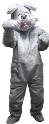
着ぐるみ ちゅースケ

1日9,000 2日11,250 3日13,500 4日14,625 5日15,750 6日16,875 7日18,000 その後+790 30日36,000