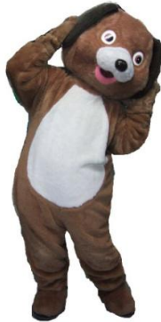
ぬいぐるみ わんちゃん

1日12,000 2日15,000 3日18,000 4日19,500 5日21,000 6日22,500 7日24,000 その後+1,050 30日48,000