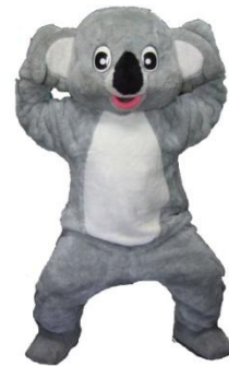
ぬいぐるみ かわいいコアラ

1日12,000 2日15,000 3日18,000 4日19,500 5日21,000 6日22,500 7日24,000 その後+1,050 30日48,000