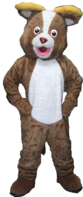
ぬいぐるみ 俺はトナカイだ

1日13,000 2日16,250 3日19,500 4日21,125 5日22,750 6日24,375 7日26,000 その後+1,130 30日52,000