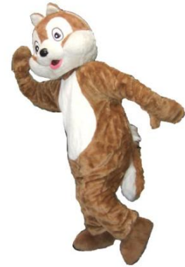
ぬいぐるみ リリースのリス

1日11,000 2日13,750 3日16,500 4日17,880 5日19,260 6日20,640 7日22,000 その後+960 30日44,000