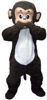
ぬいぐるみ さるちゃん

1日9,000 2日11,250 3日13,500 4日14,625 5日15,750 6日16,875 7日18,000 その後+790 30日36,000