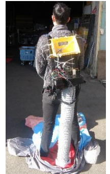
※送風機装着時 重量: 約6.3kg