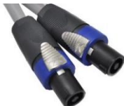
スピコンススピコン