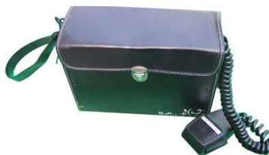
ショルダー型拡声器

1~3日1,500 4日1,625 5日1,750 6日1,875 7日2,000 その後+90 30日4,000