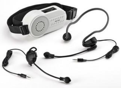
ハンズフリーメガホン

1~3日1,500 4日1,625 5日1,750 6日1,875 7日2,000 その後+90 30日4,000