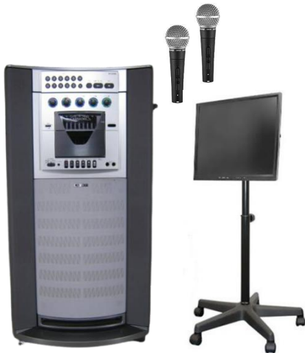
モニター&スタンド付

1日7,000 2日8,750 3日10,500 4日11,380 5日12,260 6日13,140 7日14,000 その後+610 30日28,000