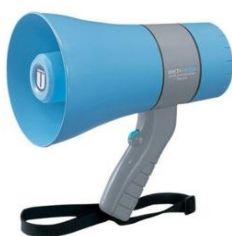
拡声器6W/TR-215A 防滴タイプ

1日1,500 2日1,875 3日2,250 4日2,438 5日2,625 6日2,813 7日3,000 その後+130 30日6,000