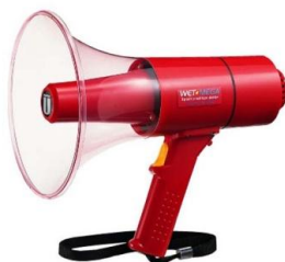
拡声器15W/TR-315S 防滴タイプ(サイレン付)

1日2,500 2日3,125 3日3,750 4日4,063 5日4,375 6日4,688 7日5,000 その後+220 30日10,000