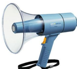
拡声器15W/TR-315 防滴タイプ

1日2,200 2日2,750 3日3,300 4日3,575 5日3,850 6日4,125 7日4,400 その後+190 30日8,800