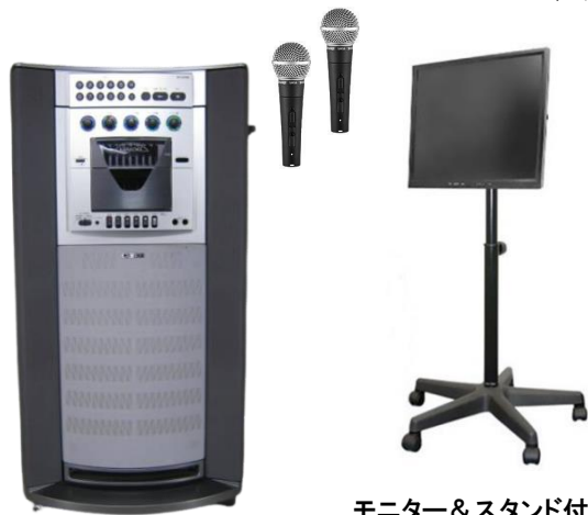
モニター&スタンド付

型番:DS-5550A 30W+30W ステレオ4スピーカー 外寸:W456×H885×D356mm 重量:約23kg 【付属品】 有線マイク(ケーブル・ケース付)×2 選曲リモコン 歌本×2 取扱説明書 モニター(スタンド付) 映像ケーブル