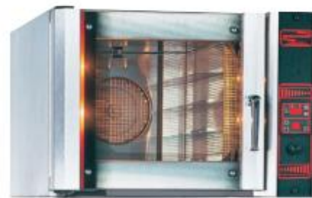
電気オーブン (9.7kw/対流式)