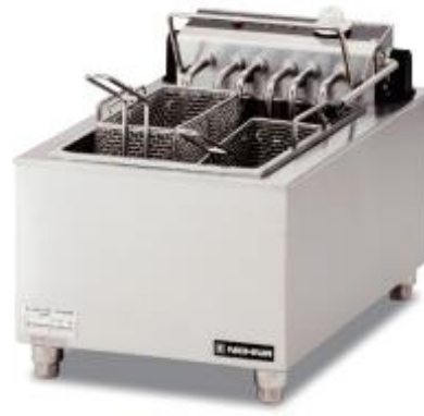
電気フライヤー (卓上タイプ/1槽式)

6kw 〈FAE-9060〉 W380×D600×H406 4kw 〈FAE-9040〉 W380×D600×H406