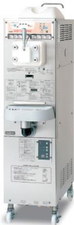
パナソニック製 ソフトクリームサーバー