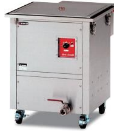
電気蒸し器 (Nタイプ/6kw/水道直結式)

1～5日 150,000 6～11日 200,100 12～28日 300,000