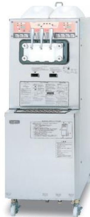
パナソニック製 ソフトクリームサーバー (3連)