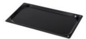
電気オーブン (6.2kw) 用焼皿