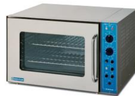
電気オーブン (6.2kw/対流式)