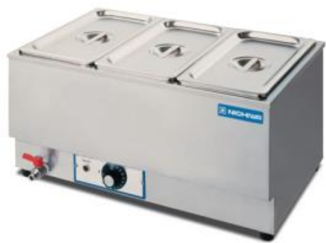
電気卓上ウォーマー (900w/角ポット1/3 湯煎式)