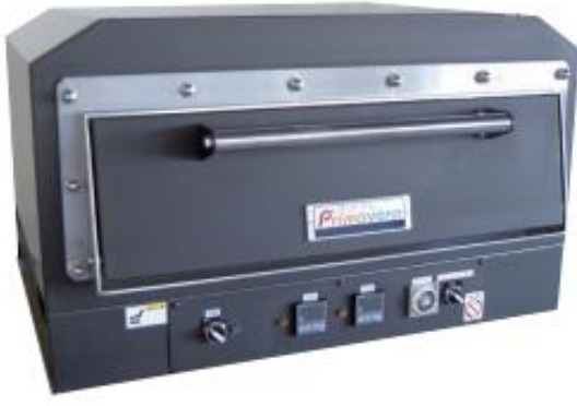
スーパーピザオーブン (4.5kw/500℃対応)