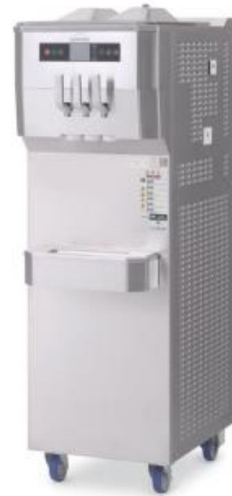
カルビジャーニ ソフトクリームサーバー