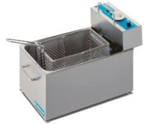
電気ミニフライヤー (1.4kw)

※ 〈FAE-9001〉 W250×D456×H327 ※遠方からの取り寄せ品です。