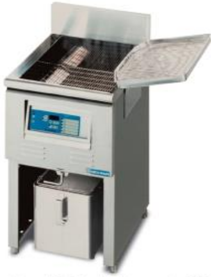
電気フライヤー (床置タイプ/6kw/1槽式)