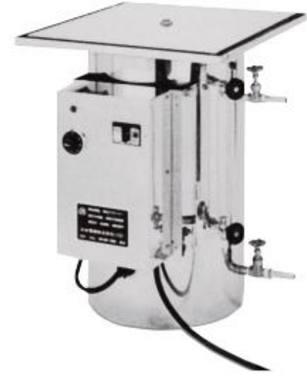
電気蒸し器 (B-2タイプ/6kw)